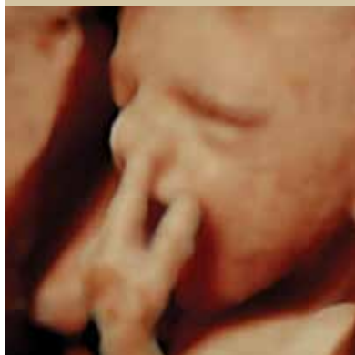
מחטט באך (שבוע 29)