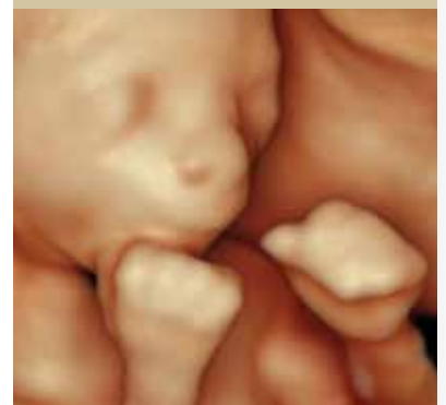
המתאגרף (שבוע 15)