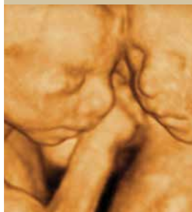
אין כמו אהבת אח לאחיו (שבוע 22)