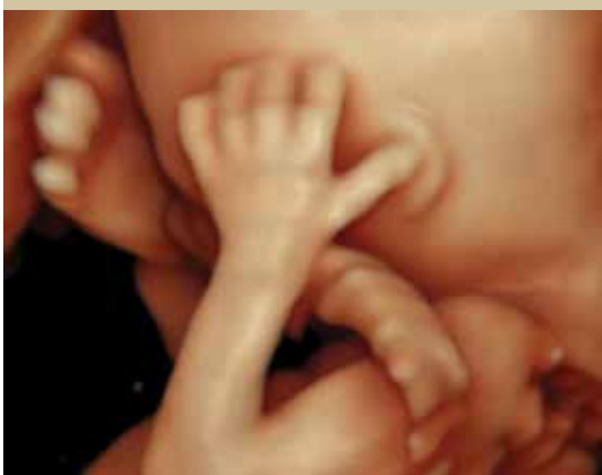
מתאמן לדיבור בסמארטפון (שבוע 15)