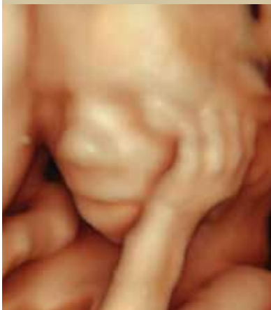
אוי ויי - עובר של פולניה (שבוע 15)