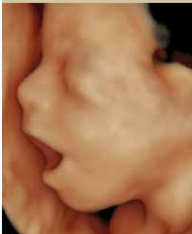
מותר לשיר ברחם (שבוע 24)