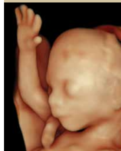
שלום ולהתראות כשאצא (שבוע 15)