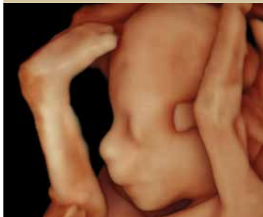
הוא חשב שמצדיעים ברגל (שבוע 15)