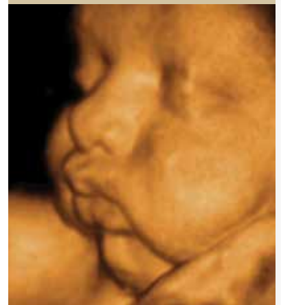
השמנת יתר מתחילה מוקדם (שבוע 35)